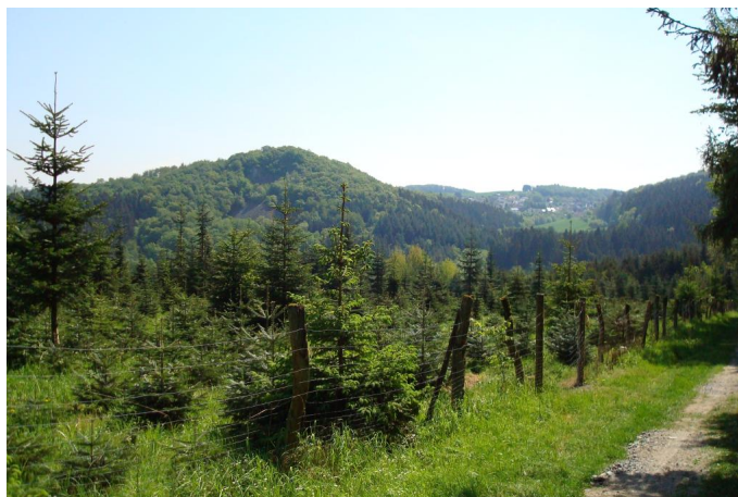
Blick auf Bornkasten